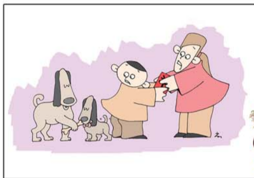
发红包 尚军 (青岛)