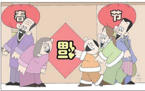
福“到”了! 尚军 (青岛)