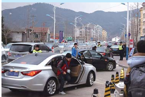
9日,烟台二中南校门口,在交警指挥下,部分家长让孩子提前下车,步行到学校。