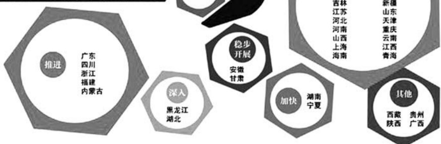
31 省市区政府工作报告如何提国企改革?

大”事项、履行社会责任、履职待遇及业务支出等方面有关信息, 以适当方式向社会公开。2015年6月底前, 省管企业公开向社会披露2014年度应当披露的有关信息。自2016年开始, 按照上市公司要求规范地进行信息披露, 提高企业经营管理透明度。