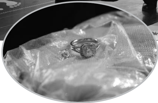
▲办案民警正在清点赃物。