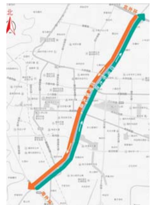
岔河西大道、岔河东大道单行道交通示意图。