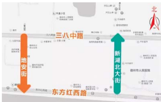
地安街、新湖北大街单行道交通示意图。