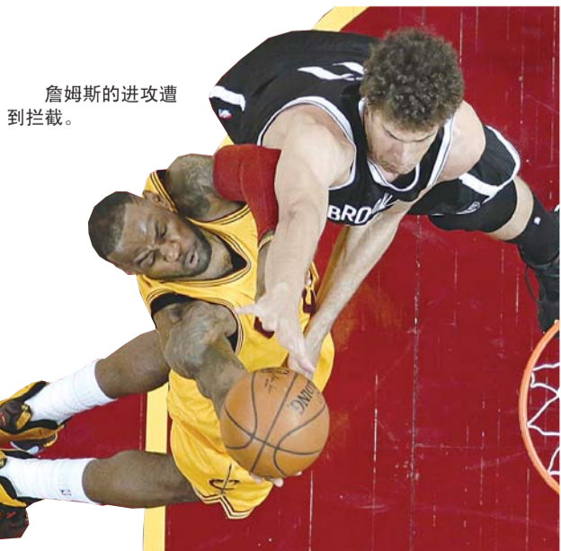
詹姆斯的进攻遭到拦截。