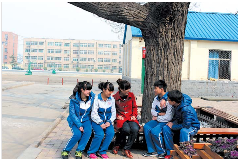
给学生谈心的“老大”。