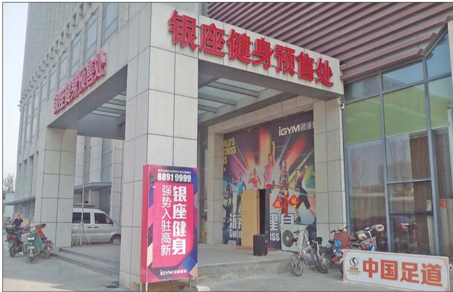
预售卡卖了,健身馆还没开业。

在门店内,记者咨询了相关负责人,据介绍,该店面自去年8月份就开始准备发售预售卡,但因会员没有达到理想状态,只好拖后开业时间。但该负