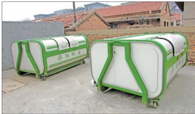
雅居园西苑新增两个垃圾箱。

“垃圾虽已清理干净,来扔垃圾的市民仍习惯性地扔到垃圾箱周围。”居民艾女士说,垃圾箱还没堆满,周边的垃圾却堆得比垃圾箱里还多。