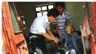
到留守老人家中走访