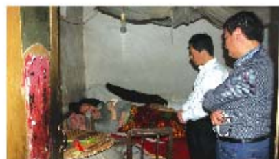
为患病在床的联系户进行上门体检

除了加强养老工作建设,在社会事务方面,还将不断提升婚姻登记服务水平,确保婚姻登记合格率100%。依法开展收养登记工作,提升收养登记制度化、规范化水平。加快农村公益性殡葬设施建设,继续改善县殡仪馆环境,提升殡葬服务能力。积极探索殡葬改革,广泛开展移风易俗活动,贯彻落实殡葬惠民政策,切实减轻困难群众的后顾之忧。