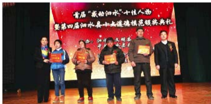
资助家庭困难道德模范

另外,为1469名享受最低生活保障待遇的80岁以上老年人发放高龄津贴70余万元,新增居家