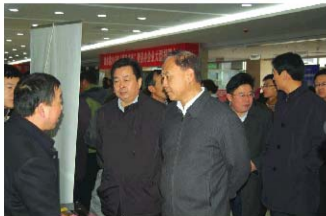
泗水县2015年春风送岗活动暨县内企业大型招聘会

伤保险参保人数96880人，生育保险参保人数18610人，失业保险参保人数29900人。五项保险累计征缴6.22亿元，累计支出6.41亿元，累计结余9.60亿元。