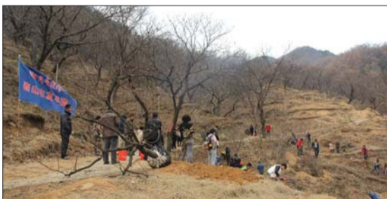
车友们分散开分别植树。