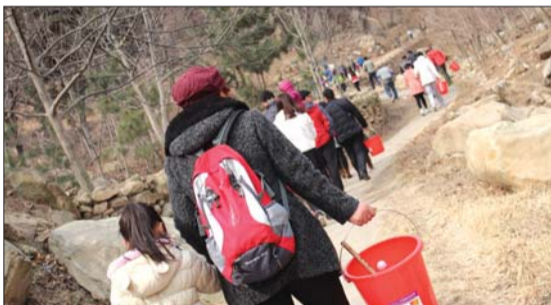
爬山植树装备齐全。