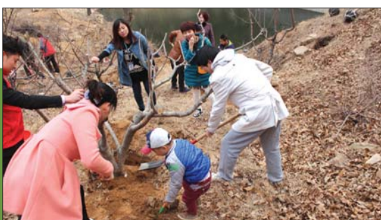
栽下爱心树,看我多努力。