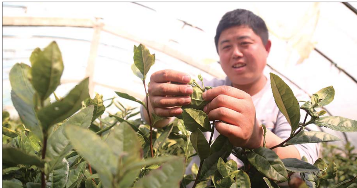
20日,在海阳市一处茶叶大棚内,明前茶已开始少量采摘。受气候影响,今年本地明前茶采摘时间比去年晚四五天。

本报3月20日讯(记者 李静 实习生 张宁) 清明节临近,烟台本地茶已开始采摘。20日,记者探访海阳绿茶产地发现,受气候影响,今年本地明前茶采摘时间比去年晚四五天,预计24日左右可以大量采摘。据了解,今年明前茶销售价格每斤1600元到2500元,比去年便宜近半。