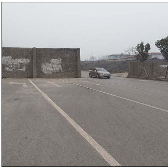
横在路上的墙挡住了6个车道。

在现场,记者注意到,横在路上的墙体上,一侧面裸露着砖石结构,另一侧则进行了粉刷,上面还写着一楼体广告的指示牌。到底这堵墙为何立在马路中间,归属何方呢?记者并没有了解到具体信息。住在附近的居民表示,不管如何,相关部门应该从安全角度考虑,清除路面上的障碍。