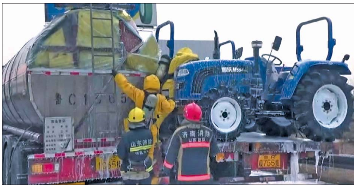
消防官兵穿戴轻型防化服,用木块、肥皂对破损的罐体进行堵漏。视频截图

本报96706热线消息(记者 尉伟 实习生 韩秋阳 侯鹏超) 3月22日下午,济青高速唐王立交东侧,一辆载有31吨氯丙烯的罐车不慎与一辆载有拖拉机的货车发生碰撞刮擦,罐体受损,大量氯丙烯液体泄漏。消防人员在喷洒了十余吨清水、泡沫后,成功堵漏化解了险情。