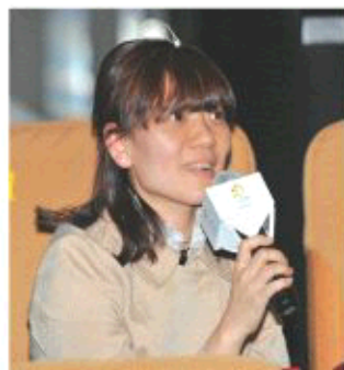
一位妈妈针对专家提出的儿童安全问题给出了自己的答案