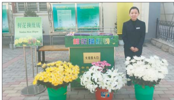
济南市殡仪馆开展“鲜花换纸钱”活动。

880元,海葬费用为1490元(不含路费、住宿等费用),为鼓励更多市民选择生态安葬,济南市民政局将继续通过政府购买服务的方式为参加树葬、花坛葬、海葬活动的丧属给予补贴。“参加树葬、花坛葬