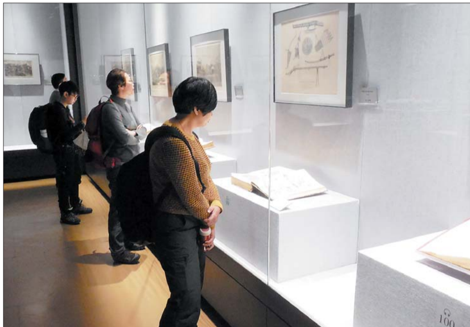
“圆明园特展”吸引众多市民参观。

子的形象。因为只有在中国,才将老虎尊为百兽之王,所以这件虎首铜像设计中包含中西合璧的意思更为典型。猪首尖嘴长吻,獠牙外凸,颇似野猪的形象,但蒲扇般的大耳,又有浓厚的中国传统优美趣味,融合了东西方造型的艺术特点。”