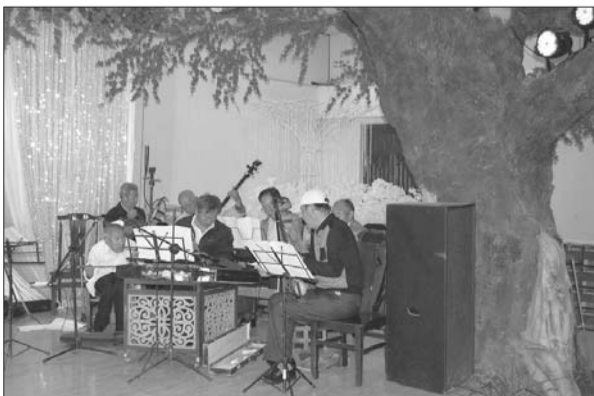
仓南村的老年活动室设备齐全,老人们在这里发展自己的兴趣爱好,每天都充实和欢愉。

仓南村位于莱州湾畔,是个地道的渔村,现有630户1720人,集体产业有一处海参水产养殖厂和一处育苗厂,村集体收入每年在600多万元。村里每年给每位村民全额缴纳新农合费用,给每个家庭缴纳“平安家园”保险,给50岁以上的村民全部缴纳意外伤害保险,“五保户”供养率达到100%,对65岁以上的村民还另外发放700-1200元的生活补贴。