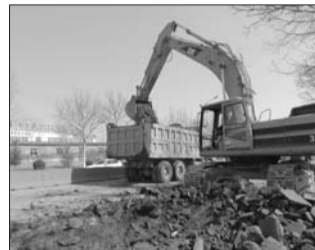
G309莱阳境路面中修工程开工。

本报3月26日讯(记者 赵金阳 通讯员 海涛 世涛 安静) 近日,在莱阳市姚格庄村西,莱阳公路局施工人员正在加紧对G309旧路面进行挖除工作。据现场工作人员介绍,为进一步提升道路通行能力,方便群众出行,从23日起,莱阳公路局对G309路面实施中修工程,施工期间,将实行半幅通车,敬请过往车主减速慢行。