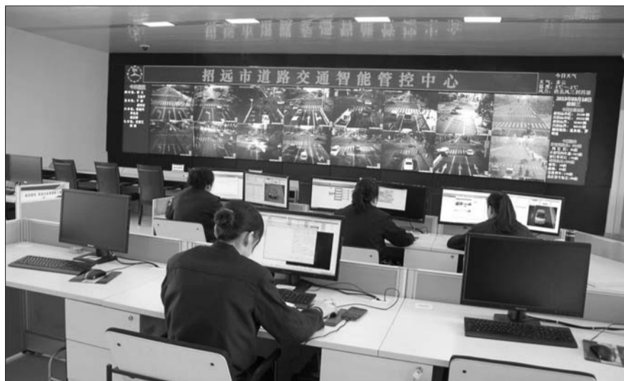
招远市道路交通智能管控中心

目前,招远市区已建有60个路口的信号灯,全部实现集中协调控制,可有效减少市区交通拥堵,提高道路通行效率。招远市区共有各类治安卡口13处,另外还有49处带卡口功能的电子警察系统,以往单兵作战的“天眼”被集成到统一管控平台中,共同编织起一张无形的“天网”。“天网”之下,既能规范人们的交通行为,还能统一远程控制交通信号,追踪嫌疑车辆等。