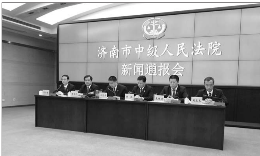
27日,济南中院召开新闻通报会,公布了54名“老赖”名单。

下一步济南中院将通过市文明办的红黑榜、媒体、中院官方微信、微博、手机电视、LED大屏幕等方式广泛曝光失信被执行人信息。