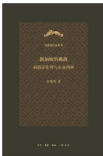
生活·读书·新知三联书店 姜杜维明著 《新加坡的挑战》