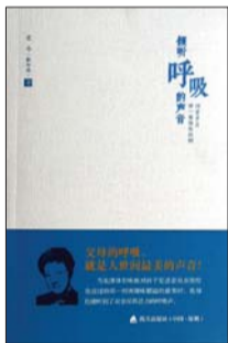
海天出版社 新加坡尤今著 《倾听呼吸的声音》