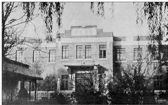
1934年建的省图“奎虚书库”楼东立面。(资料片)