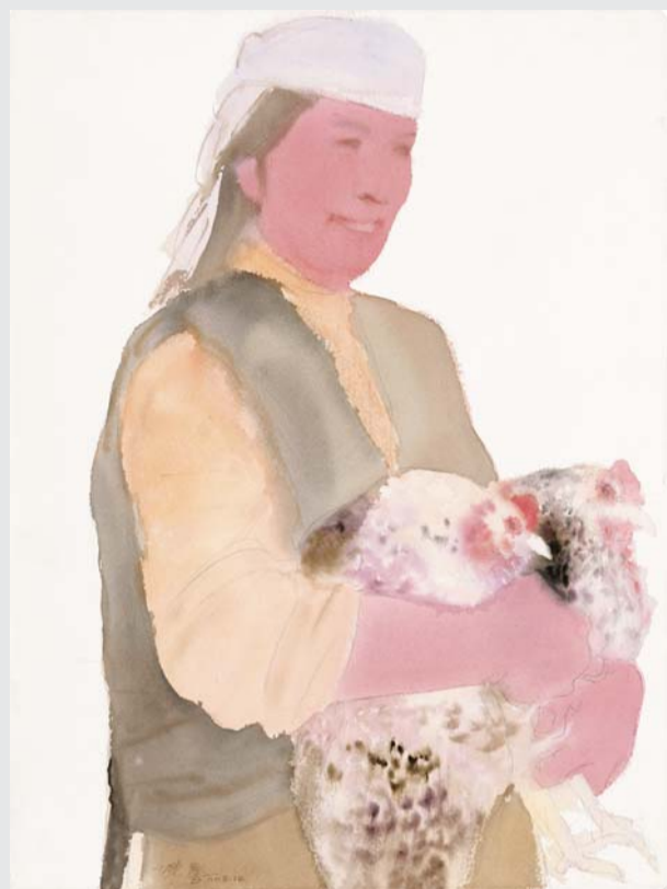
▲班迪尔乡人物写生

主办单位:中国美术家协会、山东省文化厅 承办单位:中国美协水彩艺委会、山东美术馆 展览时间:2015年3月29日—4月18日; 展览地点:山东美术馆B4、B5展厅; 展览内容:水彩作品200余幅。