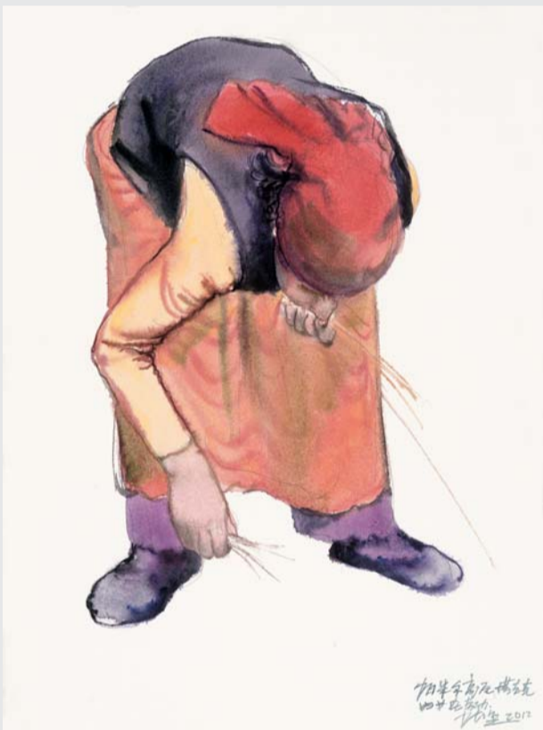
▲塔吉克妇女在劳动