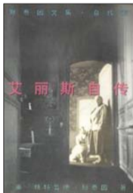
作家出版社 [美]格特鲁德·斯泰因 著 《艾丽斯自传》