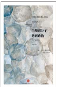
新星出版社 [美]马克·里拉 著 《当知识分子遇到政治》