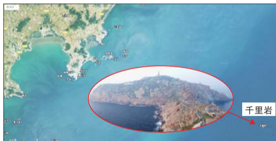
千里岩岛隶属于海阳市,总面积15.06公顷。

烟台作为山东省拥有无居民海岛最多的城市,此前由于政策和开发成本等种种原因,使得烟台人的“岛主梦”难以实现。如今随着相关规定的实施,可能又要掀起一股海岛拍卖热潮。