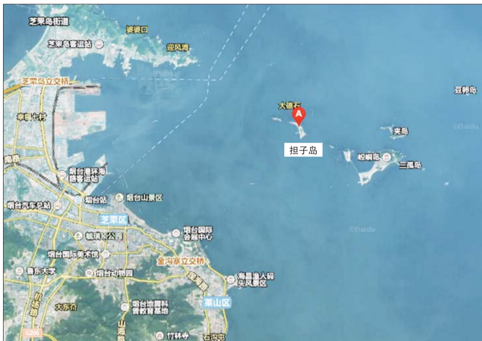
担子岛距大陆岸线最近点只有2.3海里,是离烟台市区最近的无居民海岛。

为进一步对海岛进行保护和修复,烟台市已建设6个涉及海岛的自然保护区,其中,国家级自然保护区1个,是山东长岛国家级自然保护区,主要保护对象是鹰、隼等猛禽及候鸟;省级自然保护区4个,是庙岛群岛斑海豹自然保护区、庙岛群岛海洋自然保护区、烟台崆峒列岛自然保护区和海阳千里岩海洋生态自然保护区,主要保护对象是岛屿生态系统、斑海豹及林木、岛类资源等;市级自然保护区1个,是龙口依鸟自然保护区,主要保护对象是岛屿生态系统。