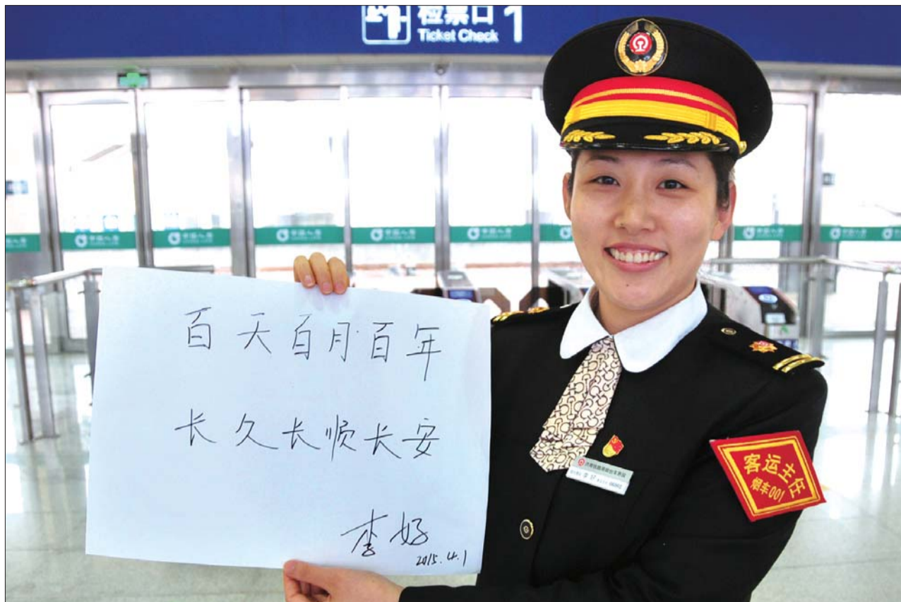
烟台南站工作人员对城铁的祝福。

与此同时，“城铁开通后，从内陆来烟台的散客增加了好几倍，对发掘烟台旅游资源带动很大。”烟台一家旅行社的负责人说，青荣城铁的开通给烟台带来大量的客流，原有的一些常规旅游线路已经不能满足游客的需求，目前旅行社已经开始设计一些全新的一日游、两日游产品，迎接城铁带来的客流。“相信五一到十一这段时间将会是青烟威持续不断的旅游旺季。”省内一家旅行社的负责人告