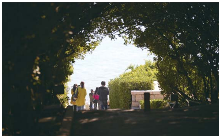
青荣城铁带动了烟威地区的旅游发展。 宋磊 摄(资料片)