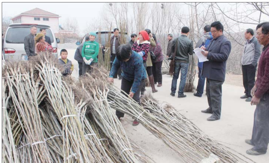
为贫困户免费发放核桃苗。