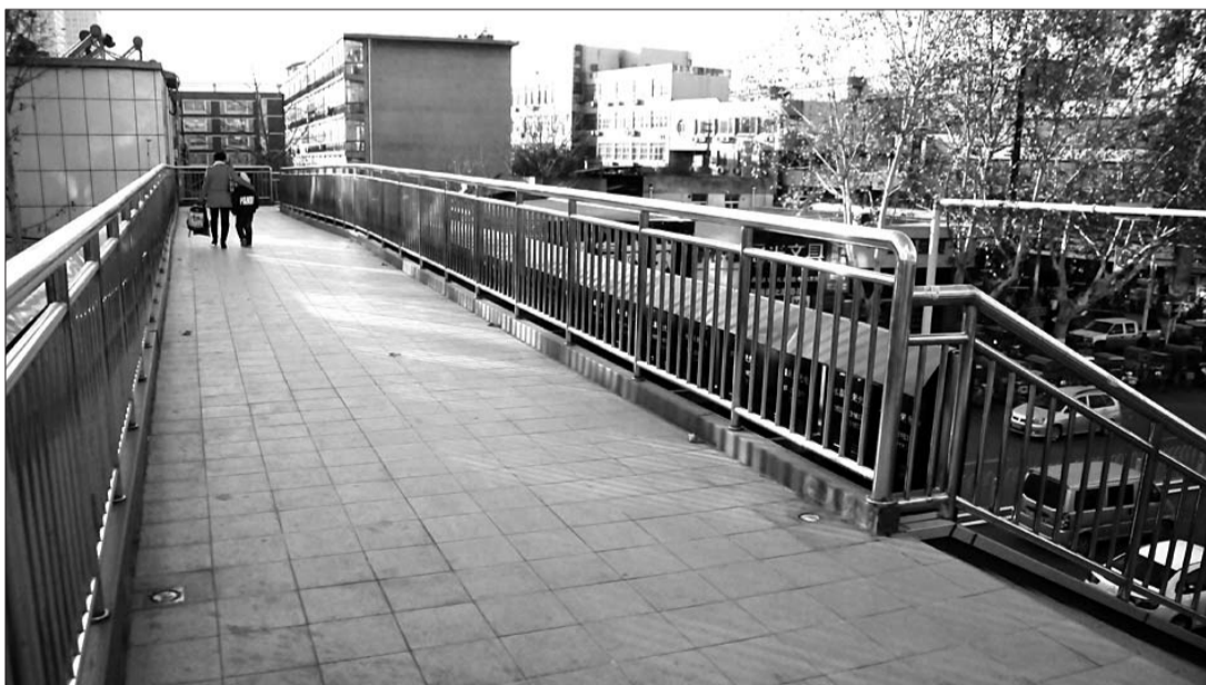
建设路上的一处天桥上,行人并不多。

本报济宁4月12日讯(记者 苏洪印) 城区规划建设的天桥上则显得冷清不少,桥下路口被封效果仍不大。9日,记者走访部分通行的天桥发现,除个别外,大部分天桥使用率并不高,即使上下班高峰期也少有人走。对此,交警部门封堵了部分桥下路口,但效果仍不明显。