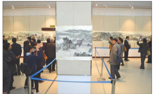
市民在观看泰山胜迹图。

根据安排,组委会将于4月10日至9月20日分别在泰安、郑州、上海、银川、长沙、兰州、西安、合肥、成都、南昌、北京举办中华胜迹文化行——泰山胜迹图诗联书画艺术展巡回展。其中,泰安为第一站,展出时间为4月10日至4月13日,市美术馆展区开馆时间为每天9时至16时30分。展出结束后,由拍卖公司对泰山胜迹图(写意卷)、泰山胜迹诗联书法长卷,当代实力派艺术家创作的中华名园、中华名山的150幅诗联书画作品进行公益拍卖,拍卖所得用于中华胜迹文化复兴工程。