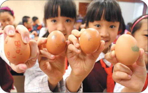
13日,济南市解放路第一小学“生命课程”开课了,这是一堂特殊的课,主讲人不是学校老师,而是家长辅导员。课堂上,每一名学生都拿到了一个生鸡蛋,作为自己的“蛋宝宝”。在随后的一周时间里,他们将开展“护蛋”行动,体会父母的不易和生命的可贵。