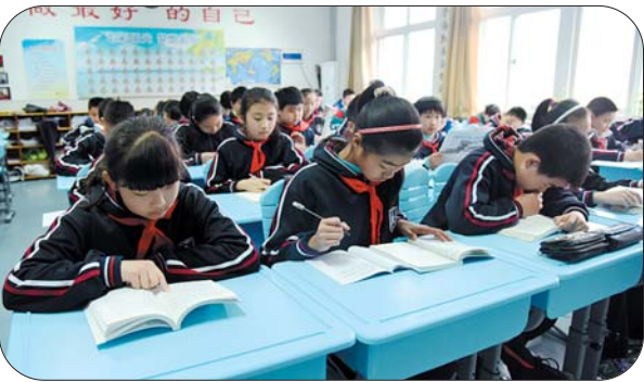
13日,山师附小为学生更换2800套新桌椅。桌面和凳面采用环保材料,方便学生调整桌椅,弧形设计,保障学生安全、舒适度。