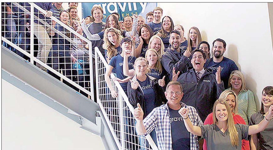
重力支付公司的员工乐翻了天。