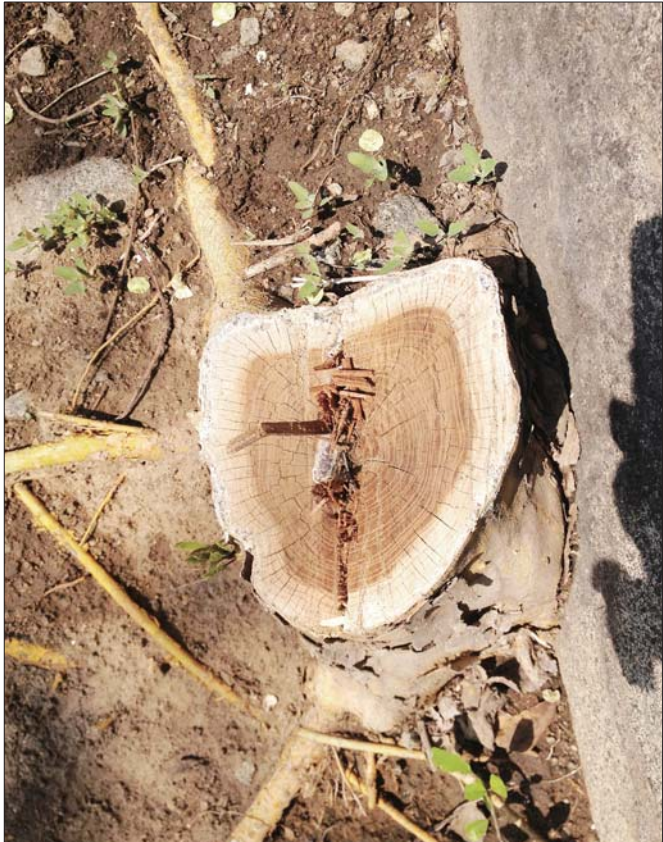
华山上被砍的柘树只剩下树墩。