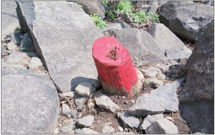
柘树被砍伐后，华山工作人员涂上了一层红漆。