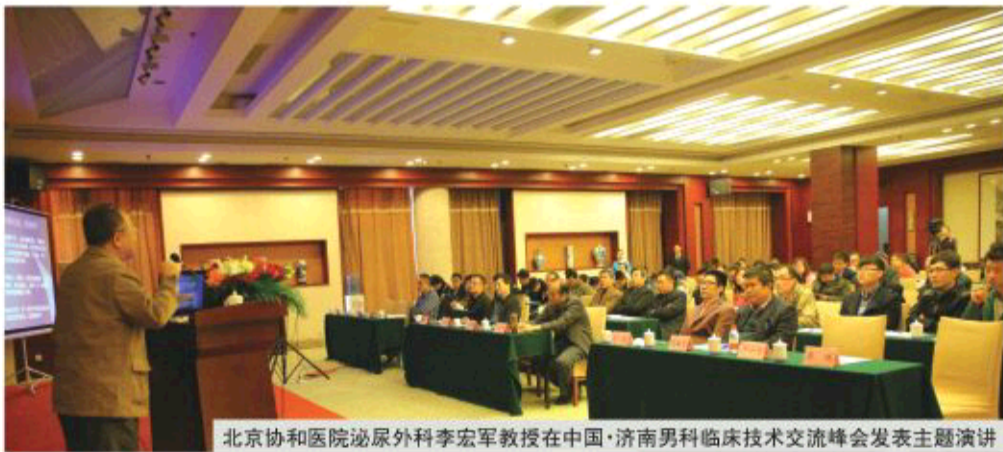
北京协和医院泌尿外科李宏军教授在中国·济南男科临床技术交流峰会发表主题演讲

为让“2015中国·济南男科临床技术交流峰会”新理念、新技术惠及更多患者,挽救“轻爱族”这一特别行动在会议举办单位——山东东方男科医院开展起来,“轻爱族”这一群体开始受到人们的关注。一段时间以来,不少“轻爱族”走出疾病的阴霾,重获健康生活的阳光。在不少“轻爱族”喜上心头之际,他们得到的答案是规范诊疗,而专家却表示,确保规范诊疗,需要诊断明确,诊疗方案有针对性。