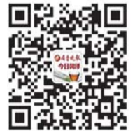
齐鲁晚报今日菏泽官方微信二维码

提示:数量有限,一个微信号限领一张票,严禁用已领取过门票的手机再次领取,请遵守规则。