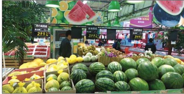
超市内,“黑美人”西瓜产自越南。

间,“黑美人”西瓜一个也没卖出去,其他西瓜也受了影响。“随着天气变热,其他西瓜品种