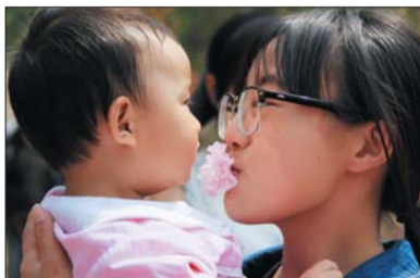
▲三等奖 作者 刘佳 奖励价值150元奖品