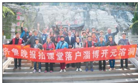
▲本报“拍课堂”第六个摄影创作实践基地落户开元溶洞。