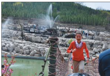
▲二等奖 作者 孙加梅 奖励价值300元奖品