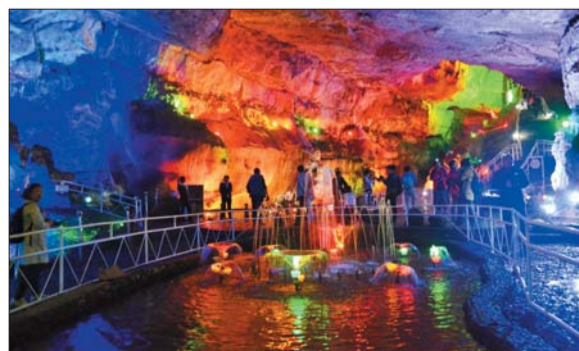
▲三等奖 作者 陈利容 奖励价值150元奖品