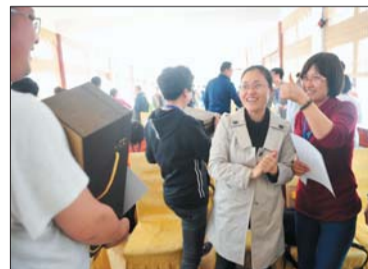
▲同学获奖表示祝贺。