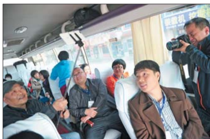
▲路途中也在“玩”摄影。

更多精彩图片见齐鲁晚报拍客网 http://zt.qlwb.com.cn/paike/ 未经本报许可,严禁转载拍客图片!