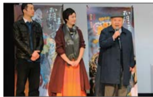
京剧电影《霸王别姬》等在京举行首映式。

本报讯 记者18日获悉,国家文化项目“京剧电影工程”取得阶段性成果:《龙凤呈祥》《霸王别姬》《状元媒》《秦香莲》《萧何月下追韩信》5部已拍摄完成,并将陆续上映;《穆桂英挂帅》《锁麟囊》《赵氏孤儿》《乾坤福寿镜》《勘玉钏》5部将于今年完成拍摄。