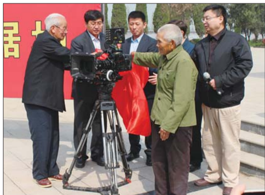
两名抗战老战士为影片开机揭幕。

电影《根据地》是山东省纪念中国人民抗日战争暨世界反法西斯战争胜利70周年的重点影片,主要反映冀鲁豫边区根据地抗日斗争胜