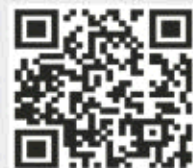
“扫描二维码,享更多优惠”

男性患者如有相关问题需要详细了解,可拨打山东东方男科医院24小时健康专线0531-82988882或直接登录山东东方男科医院官方网站 http://www.82987977.com/ 进行咨询预约。也可到英雄山路162号医院专家门诊与专家进行面对面交流。