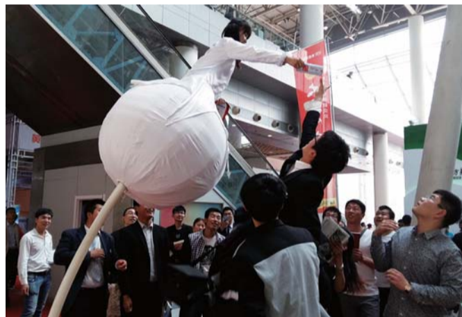
鑫苑展位上,高跷美女高空送礼发传单,被众多男士争抢。