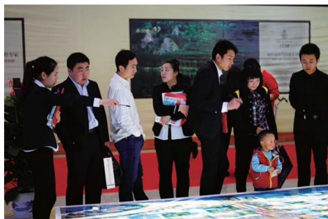
展会现场,阳光100展位前,看房者的专注和置业顾问的认真相得益彰,三天的展会紧张而有序,让不少购房者不虚此行。