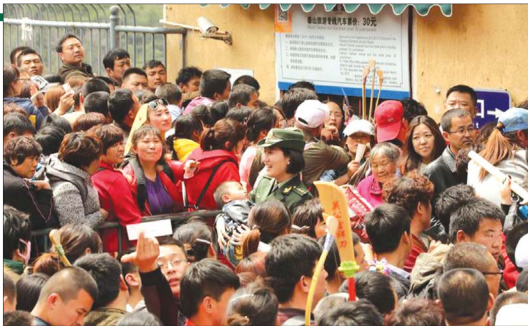
消防官兵帮游客照看孩子。

泰安消防景区大队提前部署,以碧霞祠、索道站、中天门停车场、天地广场、王母池等游客密集场所为重点,合理安排执勤人员,疏散人流,维护秩序,有效防止火灾事故和相关突发事件的发生。