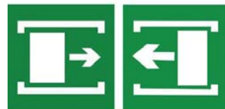
滑动开门B 滑动开门A