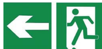
疏散通道方向 紧急出口