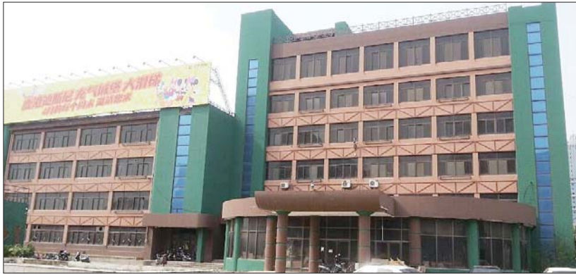
昔日的济宁硅元件厂如今已成商业街。