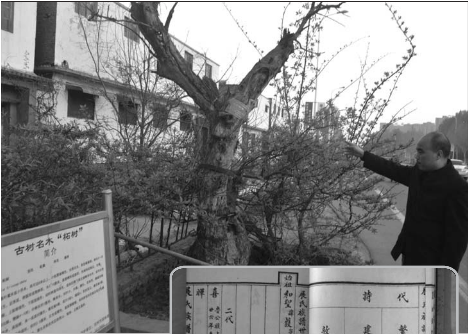
▲兖州西郊高庙村东侧的古柞树。

“族谱中记载柳下惠葬于故赵村，并有‘瑕丘之东北有里名故赵村者’的记载，而瑕丘故城正指兖州故城遗址。”柳哲说，这次来，他期待能获得更多的证据去证明这一点。