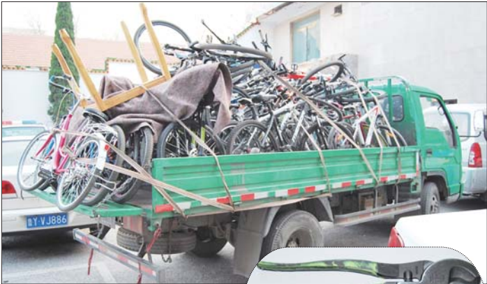
▲民警首批缴获30多辆被盗自行车。

形撬盗工具。 经审查,该男子交代自己盗窃了3辆自行车。但民警通过审查该男子的收赃方,缴获30多辆被盗窃的自行车。芝罘公安分局刑侦大队的相关人士介绍,目前分局已经成立了专案组,将对这批被盗自行车进行进一步调查。 “这条线盗窃的自行车可能远远不止这些。很多市民可能由于自行车价值不大,加上现在的自行车没有钢印之类的东西,难以辨认,所以报案的市民不是很多。”芝罘公安分局相关人士介绍,近期他们将对街面盗窃等一系列侵财行为进行重点打击,强化街面巡逻等。