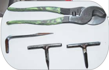
►偷车贼使用的作案工具。