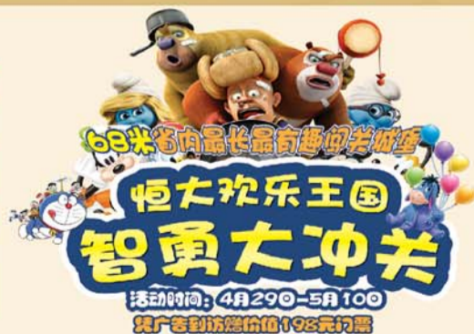
活动时间：4月29日-5月10日 凭广告到访送价值198元门票