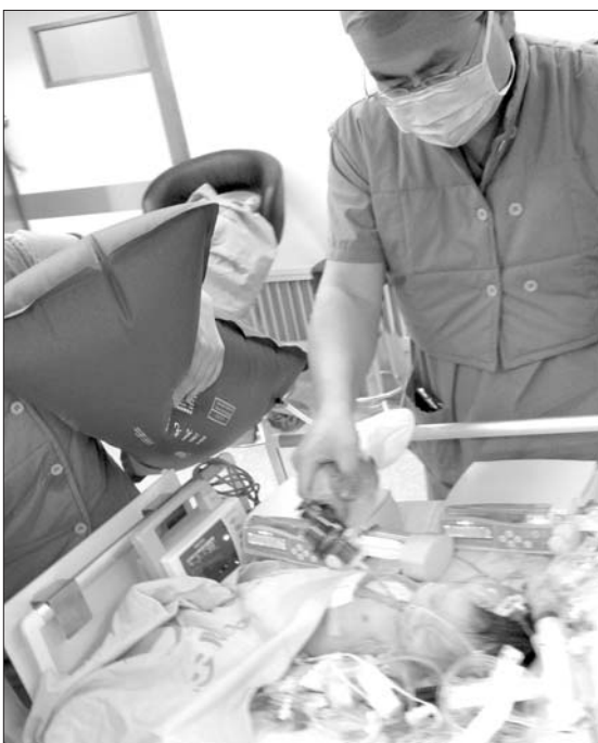
十多天大的同同身上,插着各种各样导管。