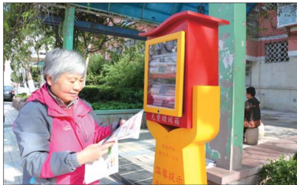
社区居民到报箱取阅报纸。

齐鲁晚报社区报《解放路大社区》自去年5月创刊以来,目前已经出版20期。社区报立足解放路街道辖区,深耕社区文化,紧紧围绕“社区”做文