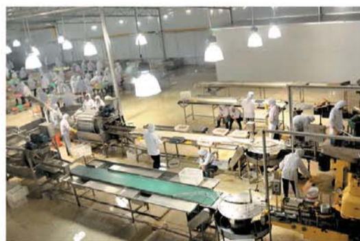
集盛双孢菇食品加工车间。