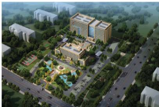
青岛保税港区济宁(邹城)功能区。