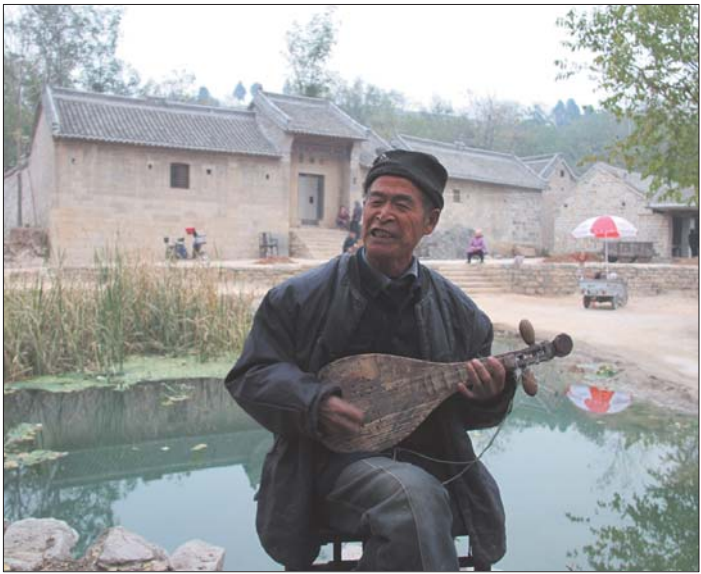
柳 琴 戏