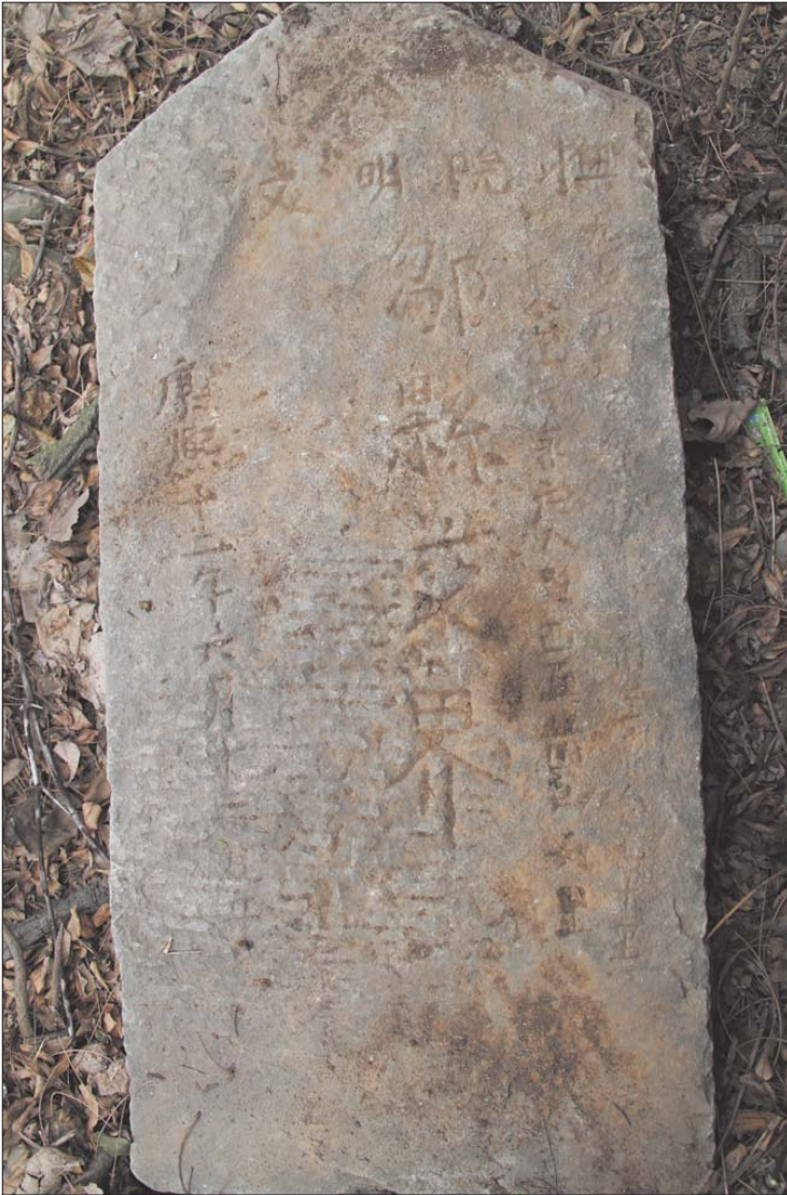
康熙十二年三县交界碑