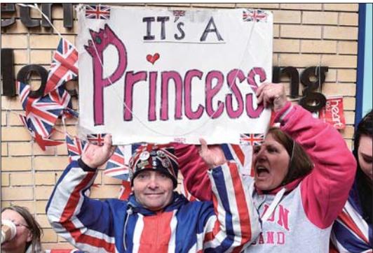
5月2日,王室粉丝在医院外庆祝凯特王妃生下小公主。