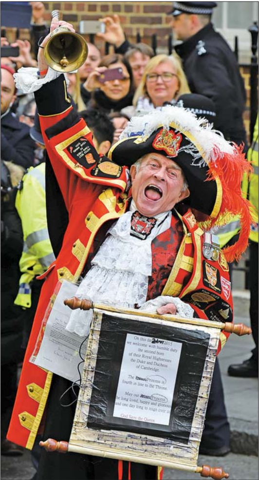
5月2日,一名街头传令员在医院外宣告凯特王妃生下小公主的消息。

要想知道小公主的名字可能还需时日。英国王室公布新生儿名字的时间没有定数,乔治小王子出生两天后名字公开,他的父亲威廉王子出生一周后名字公开,他的爷爷查尔斯王储出生一个月后名字才公开。 凯特王妃分娩前,民众纷纷对王室新丁的性别和名字下注。王室宣布凯特入院后,有关婴儿性别的“赌局”中止,而对她的名字等其他内容的“赌局”继续进行。凯特王非入院后,英国科拉尔博彩公司发言人麦吉迪说:“有很多因素可以进行猜测,王室新丁的性别、姓名、重量、头发颜色等等。全国有上万民众下注,变成非运动赛事以外的最大赌局。” 由于民众先前对凯特王妃生女孩寄予厚望,因此投注排名靠前的都是女名。艾丽斯和夏洛特这两个名字最受欢迎,其次是伊丽莎白、维多利亚和戴安娜,都贴近王室传统。舆论调查网的民调显示,最受欢迎的女孩名字分别为夏洛特、艾丽斯和亚历山德拉。 据新华社、澎湃新闻新闻