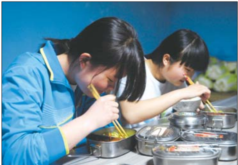
下水前赶紧趁空吃点东西。