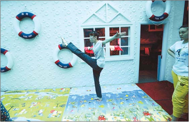
▲业余时间苦练基本功。