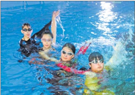
美人鱼练习花游动作。