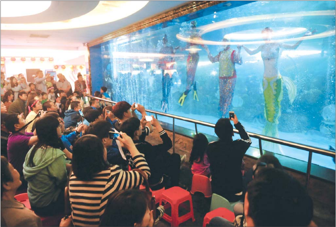
演出谢幕，面对观众的好评，再累也高兴。

海底世界的表演水池最深处达到4米，记者潜水拍摄她们表演时，戴着全套潜泳护具，依然感觉憋气和耳朵疼，不能久留。而小姑娘们从替补到当台柱子演主角，能够在水底姿态优美地进行表演，背后付出了常人难以想象的辛苦。