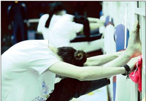
基本功练习，每日必不可少。